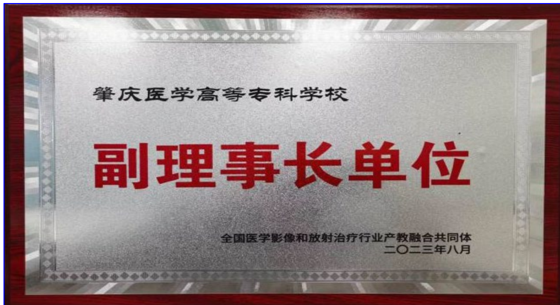
图 1 学校为全国医学影像和放射治疗行业产教融合共同体副理事长单位

我校还参与建设了“粤港澳大湾区中医药临床传承创新研究中心中医药学会联盟”。“联盟”成立于2023年10月22日，旨在进一步加强粤港澳及国际间中医药学术交流与合作，由深圳市中医药学会联合香港注册中医学学会、澳门中医药学会等单位共同推动，致力于推动岭南中医药的高质量发展和国际传播。联盟涵盖了大湾区“9+2”城市群30余家中医药相关学术社团和医疗机构，包括广东省中医院、深圳市中医院等知名医疗机构。“联盟”自成立以来，已成功举办了近百场高水平中医药学术交流活动，学术和社会影响力日益增强，成为粤港澳大湾区中医药界的品牌活动。